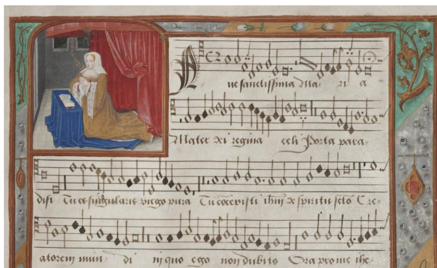
Brussel, KBR, ms. 228 ("Chansonier van Margaretha van Oostenrijk"), fol. 2r (detail)

In de voetsporen van Hare Majesteit Koningin Fabiola, die het Huis van de Polyfonie in 2011 opende, staat de Alamire Foundation sinds 2017 onder de Hoge Bescherming van Hare Majesteit Koningin Mathilde.